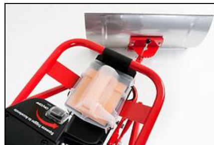
Akkuentnahme ohne Werkzeug