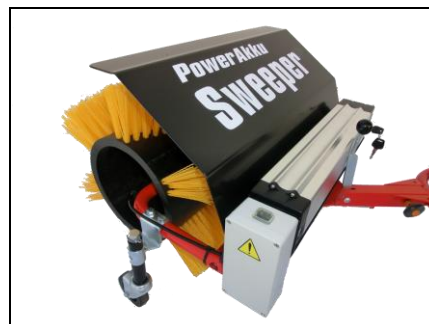
optional mit Kehrbesen 50cm inkl. integriertem Nabenmotor 500W und Lithium-Ionen Akku 36V 16Ah

Preis CHF 1135.- exkl. MwSt. + Frachtkosten ES230 CHF 30.-