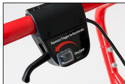
Fingerhebel mit stufenloser Geschwindigkeitsregulierung Ein/Aus Schalter