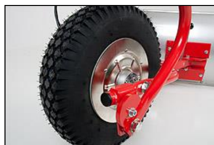
leistungsstarker 230 W Motor